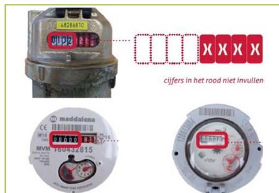
Een analoge watermeter ziet er zo uit ↑

Neem contact op met De Watergroep op www.dewatergroep.be/contact .